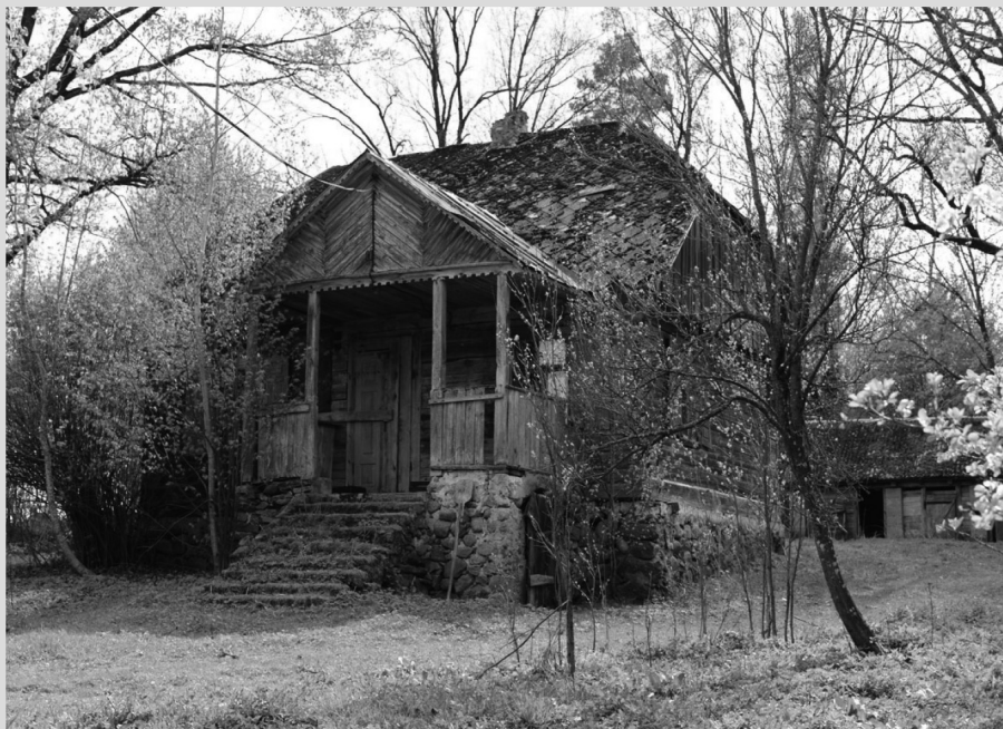
Dom wybudowany przez rodzinę kurpiowską w latach trzydziestych XX w., położony w Dubnicy Kurpiowskiej (kolonia wsi Wołyńce, gmina Kuźnica).